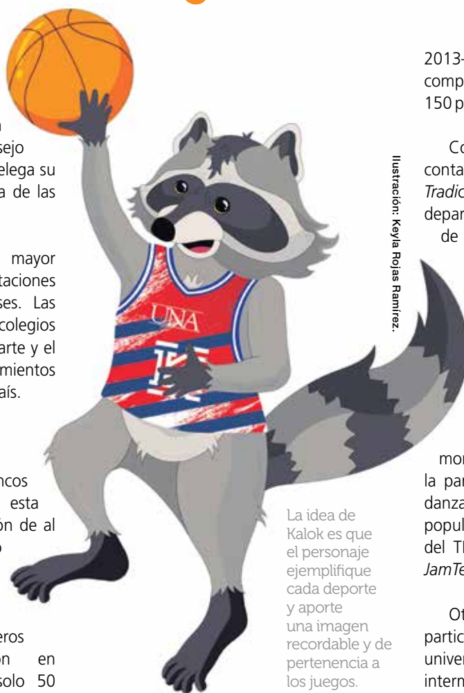
Ilustración: Keylla Rojas Ramirez.

Salazar explicó que los primeros Juncos Artísticos se realizaron en 2006, con una participación de solo 50 personas; sin embargo, para las justas de