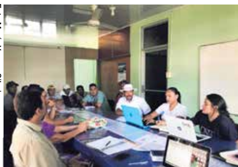
La reunión de diversos actores: estudiantes y funcionarios UNA, SENASA, MAG, INDER, sirvió para presentar propuesta Adquisición de terreno para el mejoramiento de la actividad ganadera de la Asociación de Pequeños Ganaderos de la Laguna de Mata Redonda, ante el INDER.

y beneficios. Para el desarrollo de los formularios institucionales, si es necesario el acompañamiento de la academia, por la temática a la que se refieren como: estudios de mercado, ambiental, financiero, administrativo, entre otros.