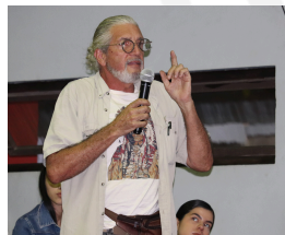
Participantes del espacio de preguntas

Comentarios como ¿Qué hacer con las limitantes que exigen a los propietarios dejar de desarrollar sus actividades, su trabajo? ya que su propiedad se encuentra marcada como uso no conforme, es decir que no es apta para trabajar como lo han hecho siempre, ¿Qué hacer si la escuela se está cayendo? ¿Qué pasa con los niños de esa escuela?