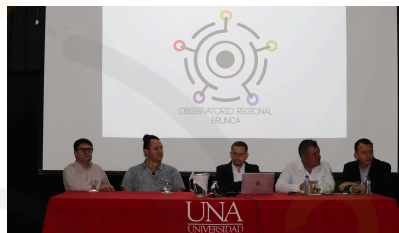
Panelistas invitados