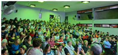
Participantes del espacio de preguntas

"COMUNICADO IMPORTANTE" advirtiendo a la población que el Foro organizado por el ORB no era un evento oficial, formativo, equitativo, ni transparente, mencionando que ningún miembro de la Municipalidad formaría parte de ese foro.