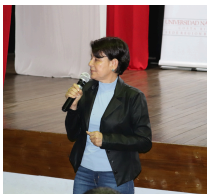
Participantes del espacio de preguntas

Se denota la preocupación de los presentes, por la falta de interés en la población por parte de la Municipalidad.